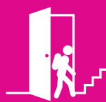
Acceso a la educación superior