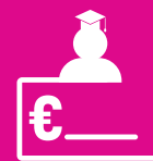
Apoyo financiero para estudiantes refugiados